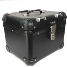
CAJUELA CUADRADA 45L PLASTICO TECHX2 NEGRA C/ RESPALDO Y SEGURO ANTIROBO SG-560