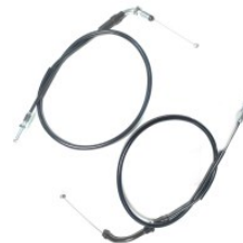
CABLE ACELERADOR (ABRIR/CERRAR) P/ CB-190R (JUEGO)