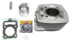
CILINDRO COMPLETO SUNGO P/ TOOL-125, P/ FT-125