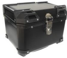
CAJUELA CUADRADA 45L PLASTICO TECHX2 NEGRA C/ RESPALDO Y SEGURO ANTIROBO SG-530