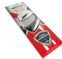
MICA TRANSPARENTE PINLOCK ANTIEMPAÑANTE, ANTIRAYADURAS PARA CASCO TECHX2 UNIVERSAL (26cm X 9.8cm)