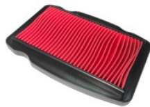
ELEMENTO FILTRO AIRE P/ CB- 190R, P/ CB-190, P/ CB-160F