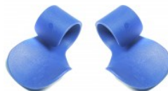
ASISTENTE ACELERADOR MOTO UNIVERSAL AZUL (BOLSA C/ 2 PIEZAS) (VENTA MINIMA POR BOLSA) (PRECIO POR PIEZA)