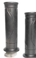
PUÑOS P/ CB-190R (PAR)