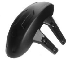
SALPICADERA TRASERA NEGRA PLASTICO UNIVERSAL PARA RIN DE 14