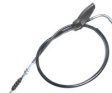
CABLE EMBRAGUE P/ CB-190R