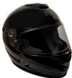
CASCO RMM 107 CERRADO NEGRO TALLA: 2 EG NORMA AMERICANA DOT