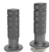
PUÑOS P/ XR-150L (PAR)