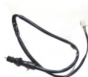
INTERRUPTOR FRENO TRASERO 12V P/ XR-150L