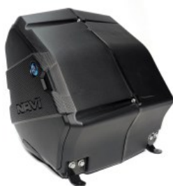
CAJUELA HERRAMIENTAS NEGRA P/ NAVI-110