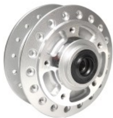
MAZA DELANTERA P/ XR-150L