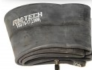
CAMARA DE BUTILO RMTECH PRES. EN CAJA 150/70-17 (2.00MM) HEAVY DUTY TR6 (VALVULA RECTA)