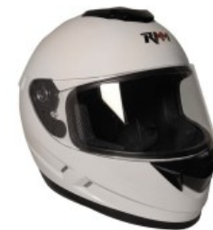
CASCO RMM 107 CERRADO BLANCO TALLA: EG NORMA AMERICANA DOT