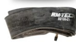
CAMARA DE BUTILO RMTECH PRES. EN CAJA 80/100-21 TR4 (VALVULA RECTA)