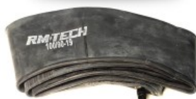
CAMARA DE BUTILO RMTECH PRES. EN CAJA 100/90-19 TR4 (VALVULA RECTA)