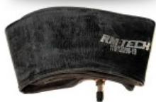
CAMARA DE BUTILO RMTECH PRES. EN CAJA 110/120/90-19 TR6 (VALVULA RECTA)