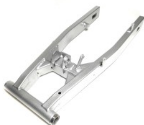
HORQUILLA TRASERA P/ XR-150L