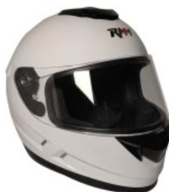
CASCO RMM 107 CERRADO BLANCO TALLA: 2 EG NORMA AMERICANA DOT