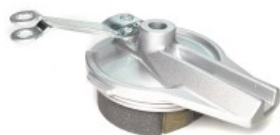
PORTA BALATA TRASERO COMPLETO P/ XR-150L