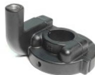
BASE PUÑO ACELERADOR P/ XR-150L