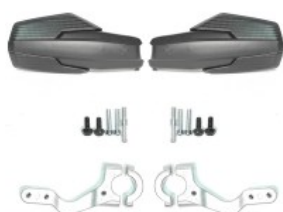
PROTECTOR DE MANIJA NEGRO P/ NAVI-110 (PAR)