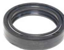
RETEN BARRA SUSPENSION P/ XR-150L (41X54X11) (PIEZA)