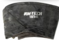
CAMARA DE BUTILO RMTECH PRES. EN CAJA 150/70-17 TR4 (VALVULA RECTA)