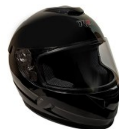
CASCO RMM 107 CERRADO NEGRO TALLA: EG NORMA AMERICANA DOT