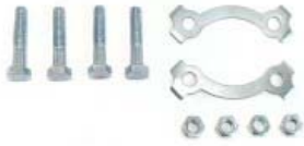
BIRLO MAZA P/ TOOL-125 (JUEGO)