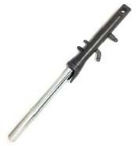
BARRA SUSPENSION DELANTERA IZQUIERDA NEGRA P/ 250Z '19-'21