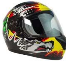
CASCO TECHX2 TX-815 INFANTIL GRAFICOS "LOBO" TALLA: EG