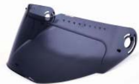
MICA CASCO TECHX2 TX-909 HUMO OSCURO