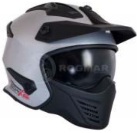
CASCO TECHX2 MODULAR TX-726X PLATA/NEGRO C/ LENTE INTERNO Y VISERATALLA: M