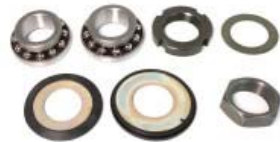
BALEROS TELESCOPIO DIRECCION P/ DM-200 (JUEGO)