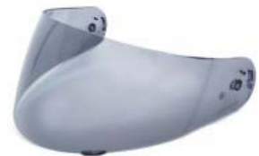
MICA CASCO TECHX2 TX-901 HUMO CLARO