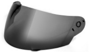
MICA CASCO TECHX2 TX-815 HUMO OSCURO