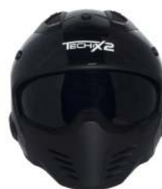
CASCO TECHX2 MODULAR TX-726X NEGRO C/LENTE INTERNO SIN VISERA TALLA: CH