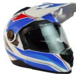
CASCO TECHX2 TX-909 CROSS/STREET ABATIBLE BLANCO/AZUL/ROJO Y LENTE INTERNO TALLA: EG