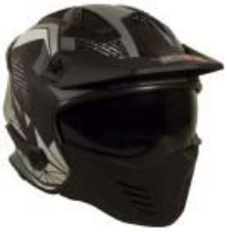
CASCO TECHX2 MODULAR TX-726X NEGRO/GRIS C/ LENTE INTERNO Y VISERA TALLA: M