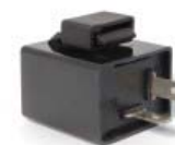
RELEVADOR (RELAY) DIRECCIONALES 12V P/ 250Z GRAFITO VERDE '19-'20