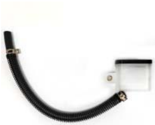
DEPOSITO LIQUIDO FRENO TRASERO P/ 250Z '17-'19, P/ 250Z '19-'21