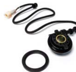
CABLE VELOCIMETRO P/ 250Z GRAFITO VERDE '19-'20