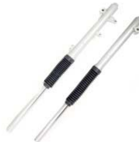
BARRA SUSPENSION DELANTERA DERECHA/IZQUIERDA P/ XR-150L (PAR)