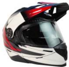
CASCO TECHX2 TX-909 CROSS/STREET ABATIBLE NEGRO/BLANCO/ROJO Y LENTE INTERNO TALLA: 2 EG