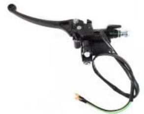
BOMBA FRENO C/ MANIJA P/ DM-200 '14-'20, P/ DM-200 SPORT '19-'20, P/ DM-250 '20, P/ DM-150 SPORT '19-'20