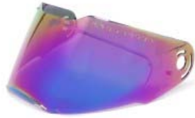
MICA CASCO TECHX2 TX-909 TORNASOL