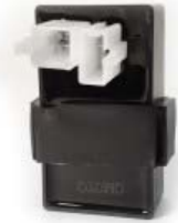
UNIDAD CDI 12V P/ 250Z GRAFITO VERDE '19-'20