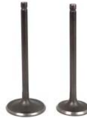
VALVULA ADMISION/ESCAPE CON SELLOS DE VALVULA Y SEGUROS P/ 250Z '19-'21 GRAFITO VERDE LIMON, P/ RT 250 '16-'20, P/ 200Z '19-'20, P/ 170Z '16-'18 (JUEGO) CÓDIGO: 128-149005