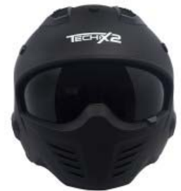
CASCO TECHX2 MODULAR TX-726X NEGRO MATE C/ LENTE INTERNO SIN VISERA TALLA: M