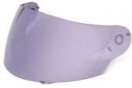
MICA CASCO TECHX2 TX-815 POLARIZADA