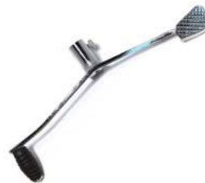
PEDAL VELOCIDADES P/ XT-110RT II '17-'19, P/ XT-110RT '20, P/ AT-110 '20 CÓDIGO: 128-143003