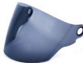
MICA CASCO TECHX2 TX-707 HUMO OSCURO