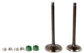
VALVULA ADMISION/ESCAPE CON SELLOS DE VALVULA Y SEGUROS P/ 250Z '14-'17, P/ 250Z '17-'19 NEGRA (JUEGO) CÓDIGO: 128-149009