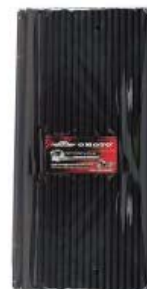
POPOTE NEGRO CUBRE RAYOS MOTOCICLETA 260MM X 6MM (BOLSA C/ 100 PIEZAS)