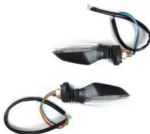
DIRECCIONAL TRASERA IZQUIERDA/DERECHA LED 12V P/ 250Z GRAFITO VERDE '19-'20 (PAR)