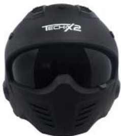
CASCO TECHX2 MODULAR TX-726X NEGRO MATE C/ LENTE INTERNO SIN VISERA TALLA: CH