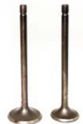
VALVULA ADMISION/ESCAPE C/ SELLOS P/ DM-200 14-'20, P/ DM-200 SPORT '19-'20, P/ DM-250 '20 (JUEGO) CÓDIGO: 128-141009