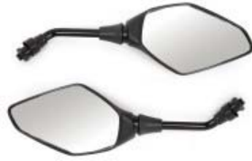
ESPEJO P/ 250Z GRAFITO VERDE '19-'20 (PAR)