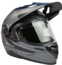
CASCO TECHX2 TX-909 CROSS/STREET ABATIBLE NEGRO MATE/GRIS Y LENTE INTERNO TALLA: 2 EG