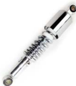
AMORTIGUADOR TRASERO P/ GN-125F (PIEZA)