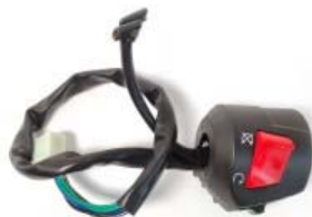
MANDO DERECHO 12V P/ 250Z GRAFITO VERDE '19-'20