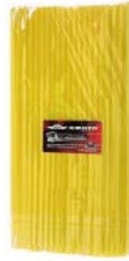
POPOTE AMARILLO CUBRE RAYOS MOTOCICLETA 260MM X 6MM (BOLSA C/ 100 PIEZAS)