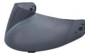
MICA CASCO TECHX2 TX-901 HUMO OSCURO