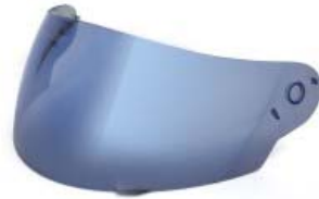
MICA CASCO TECHX2 TX-815 AZUL