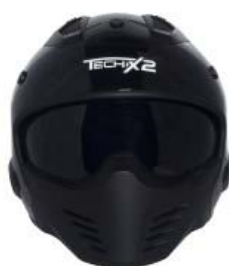
CASCO TECHX2 MODULAR TX-726X NEGRO C/LENTE INTERNO SIN VISERA TALLA: M