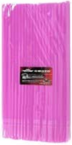
POPOTE ROSA CUBRE RAYOS MOTOCICLETA 260MM X 6MM (BOLSA C/ 100 PIEZAS)