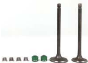
VALVULA ADMISION/ESCAPE C/ SELLOS Y SEGUROS P/ 150Z '19-'20, P/ DM-150 '18-'20 (JUEGO) CÓDIGO: 128-148004