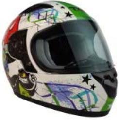
CASCO TECHX2 TX-815 INFANTIL GRAFICOS "EL BARRIO" TALLA: M