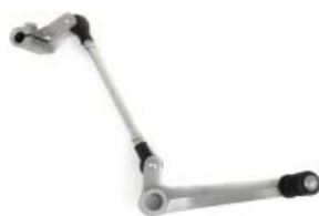
PEDAL VELOCIDADES P/ 250Z GRAFITO VERDE '19-'20 CÓDIGO: 128-149008