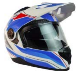
CASCO TECHX2 TX-909 CROSS/STREET ABATIBLE BLANCO/AZUL/ROJO Y LENTE INTERNO TALLA: 2 EG