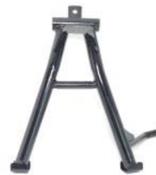
PARADOR CENTRAL P/ C-90 STR