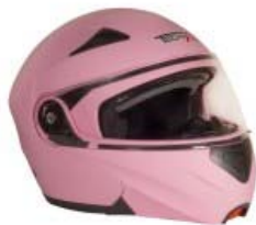
CASCO TECHX2 FORCE TX-901 ABATIBLE ROSA MATE C/ LENTE INTERNO TALLA: CH