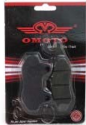
BALATAS OMOTO FRENO DISCO P/ 250Z GRAFITO VERDE LIMON '19-'21 (JUEGO)