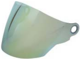
MICA CASCO TECHX2 TX-707 AMARILLA POLARIZADA