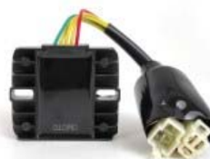
REGULADOR DE VOLTAJE 12V P/ 250Z GRAFITO VERDE '19-'20