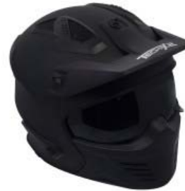
CASCO TECHX2 TX-726X NEGRO MATE C/LENTE CH