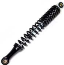
AMORTIGUADOR TRASERO P/ XT-110RT II '17-'19, P/ XT-110RT '20, P/ AT-110 '17-'20, P/ XT-110 '20, P/ XT-125RT '20