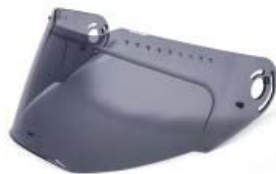
MICA CASCO TECHX2 TX-909 HUMO CLARO