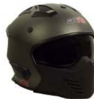
CASCO TECHX2 MODULAR TX-726X GRIS TITANIUM/NEGRO C/ LENTE INTERNO SIN VISERA TALLA: M