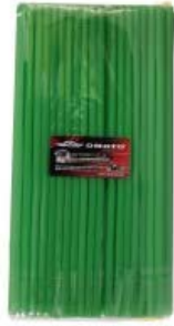
POPOTE VERDE CUBRE RAYOS MOTOCICLETA 260MM X 6MM (BOLSA C/ 100 PIEZAS)