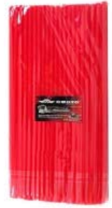
POPOTE ROJO CUBRE RAYOS MOTOCICLETA 260MM X 6MM (BOLSA C/ 100 PIEZAS)