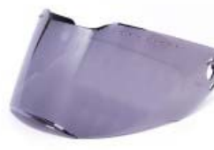
MICA CASCO TECHX2 TX-909 POLARIZADA