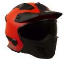
CASCO TECHX2 MODULAR TX-726X NARANJA MATE/NEGRO C/LENTE INTERNO Y VISERA TALLA: M