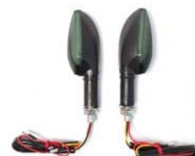
DIRECCIONAL UNIVERSAL LED 12V 3W LUZ BLANCA/AMBAR (PAR)