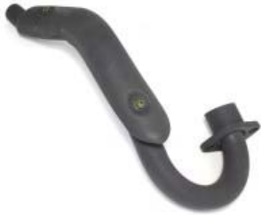
COPE CARBURADOR P/ 250Z '19-'21 (PIPETA CARBURADOR) CÓDIGO: 132-149005