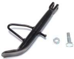
PATA LATERAL P/ XT-110RT '20, P/ XT 110RT II '17-'19, P/ XT-110 '20, P/ X-110 '17-'19, P/ AT-110 '17-'20, P/ AT-110 RT '12-'14, P/ AT-110RT LED '14-'20