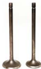
VALVULA ADMISION/ESCAPE C/ SELLOS Y SEGUROS P/ FT-125 '05-'16, P/ DT-125 '12-'19 (JUEGO)