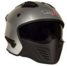
CASCO TECHX2 MODULAR TX-726X PLATA/NEGRO C/ LENTE INTERNO SIN VISERA TALLA: M