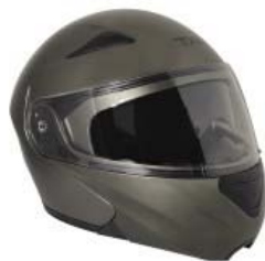
CASCO TECHX2 FORCE TX-901 ABATIBLE TITANIUM C/ LENTE INTERNO TALLA: 2 EG