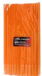
POPOTE NARANJA CUBRE RAYOS MOTOCICLETA 260MM X 6MM (BOLSA C/ 100 PIEZAS)