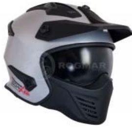
CASCO TECHX2 MODULAR TX-726X PLATA/NEGRO C/ LENTE INTERNO Y VISERATALLA: CH