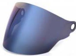
MICA CASCO TECHX2 TX-707 AZUL