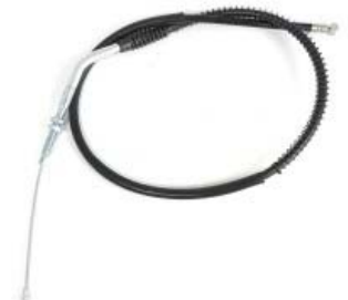
CABLE EMBRAGUE P/ 250Z GRAFITO VERDE '19-'20