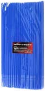
POPOTE AZUL MARINO CUBRE RAYOS MOTOCICLETA 260MM X 6MM (BOLSA C/ 100 PIEZAS)