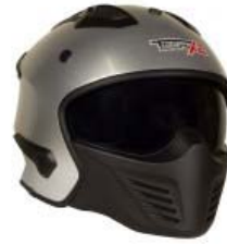
CASCO TECHX2 MODULAR TX-726X PLATA/NEGRO C/ LENTE INTERNO SIN VISERA TALLA:CH