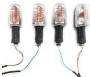
DIRECCIONAL DELANTERA/TRASERA IZQUIERDA/DERECHA 12V 10W BLANCA P/ GL-150 CARGO (PAR)