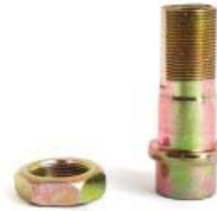
SEMI-EJE TRASERO P/ C-90 STR