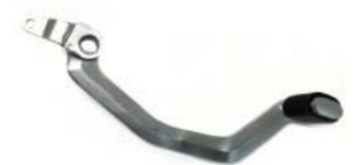
PEDAL FRENO P/ 250Z GRAFITO VERDE '19-'20 CÓDIGO: 128-149004