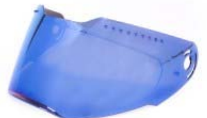
MICA CASCO TECHX2 TX-909 AZUL