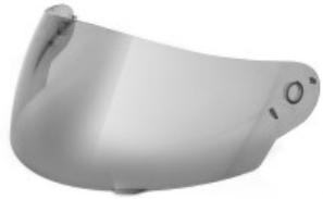
MICA CASCO TECHX2 TX-815 HUMO CLARO