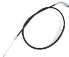
CABLE AHOGADOR P/ 250Z GRAFITO VERDE '19-'20