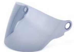
MICA CASCO TECHX2 TX-707 HUMO CLARO