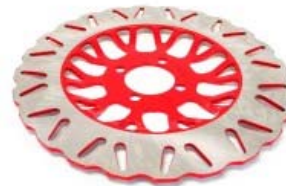
DISCO FRENO DELANTERO P/ DM-150 ROJA '18-'20