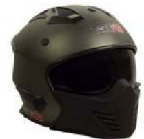
CASCO TECHX2 MODULAR TX-726X GRIS TITANIUM/NEGRO C/ LENTE INTERNO SIN VISERA TALLA: CH