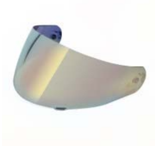
MICA CASCO TECHX2 TX-901 AMARILLA POLARIZADA