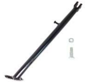
PATA LATERAL C/ TORNILLO P/ DM-150 '10-'19