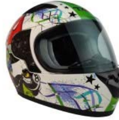
CASCO TECHX2 TX-815 INFANTIL GRAFICOS "EL BARRIO" TALLA: EG