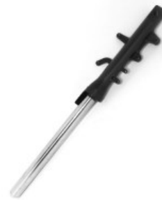
BARRA SUSPENSION DELANTERA DERECHA NEGRA P/ 250Z '19-'21