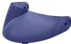
MICA CASCO TECHX2 TX-901 AZUL