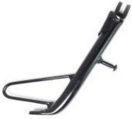
PATA LATERAL P/ 250Z '19-'21, P/ 250Z NEGRA '17-'19