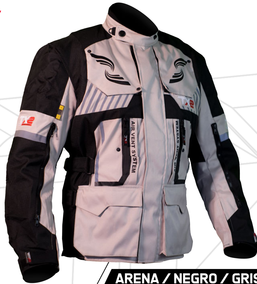
ARENA / NEGRO / GRIS